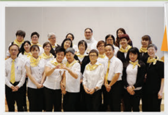
非常務送聖體員派遣禮 18/6