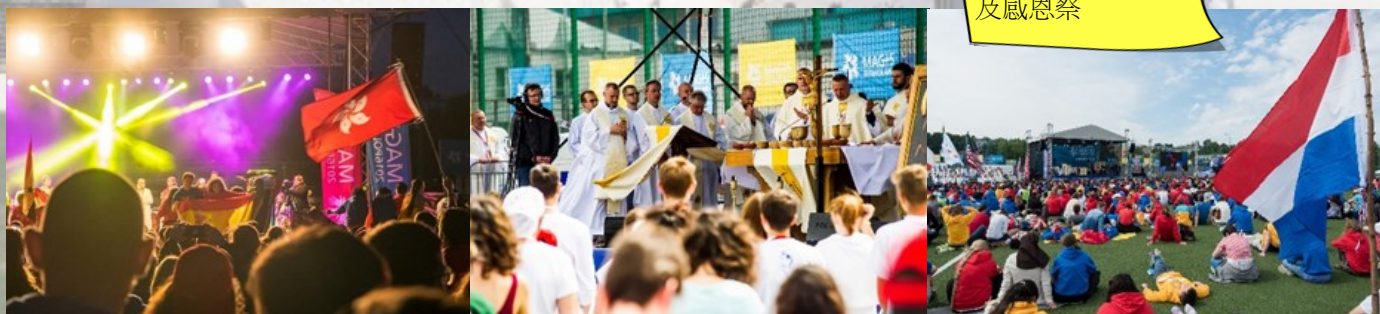
在羅茲的開幕活動及感恩祭

在我的體驗小組裏有多個不同國籍的人，包括：美國、菲律賓、波蘭、津巴布韋、香港及澳門，共18人。在這星期裏，我們住在耶穌會的會院，每天六時半起床，七時舉行早禱，七時半匆匆吃過早點後，八時便要出發到酒莊工作。工作每天都是除雜草，而工作到下午一時便回會院吃午餐，午餐後有感恩祭，然後便出市內遊覽。晚餐後，便在會院進行分享及意識醒察。每天都要凌晨才能休息睡覺，然後，第二天六時半便要起床，疲倦得很。