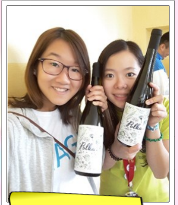
酒莊和酒莊老闆送給我們的紀念品

在世青會期裏，最令我深刻的不是見到教宗，也不是到過宏偉的聖堂朝聖，而是一個火車站的保安叔叔。當天是世青的開幕彌撒，我們沒有參與，因為到了另一個城市朝聖，當晚我們預算大約九時乘火車回寄宿家庭，車程約兩個小時，而開幕彌撒在七時多便結束，心想應該對我們沒什麼影響吧！但是火車開出時，它不但已經延誤了半小時，還在每個站都停留超過半小時，致使我們凌晨一時還在火車上！其後，到了旅程的一半，我們更突然地被趕下車，因為語言不通，我們完全不明白當中原因。就在我們十分徬徨的時候，一個略懂英語的保安叔叔用他僅有的英語，很努力與我們溝通。最後，終於弄明白，原來我們要去的車站，因為已經沒有班次，故他通知火車公司特地加設了一班列車來接載我們，但卻因為更改的列車太長，沒法進入我們要到的小型車站。所以，他們需要早一個站給我們下車。最後，我們步行了一小時的山路，在凌晨三時方安全到家。我被那個保安叔叔深深地感動了，當時已凌晨一時，而他平日放工的時間是晚上十時，他不但沒有為我們帶給他的麻煩而感到煩躁，更很友善地去幫助我們，在他身上我充份地看到慈悲及愛，是真正的 To give and not to count the cost。