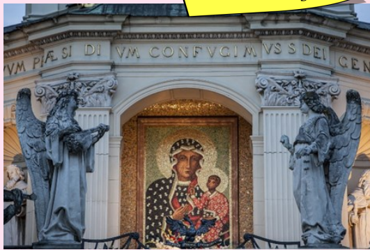
波蘭的黑聖母 朝聖地 Jasna góra

在體驗活動過後，我們便到了波蘭的另一個城市琴斯托霍瓦 (Częstochowa) 與其他小組會合，一同到波蘭的黑聖母朝聖地 Jasna góra 朝聖、明供聖體及進行修和聖事。在朝聖後，就舉行 Magis 2016 閉幕彌撒，正式結束了 Magis 2016。