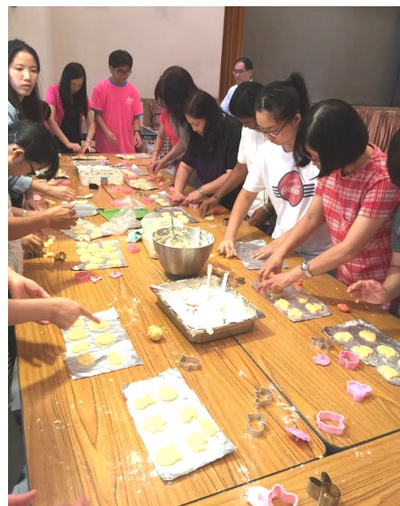
2016-10-23 曲奇餅製作 暨 福傳電影 欣賞會