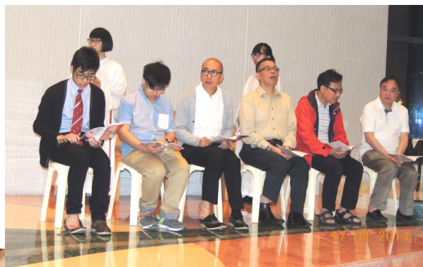
四月十七日 主的晚餐