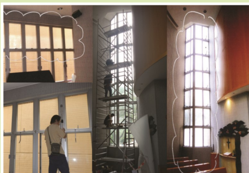
• 已完成把聖堂內亡者角與電子風琴後面兩組玻璃窗的窗較更新，並改為電動操控；以隱蔽方式在祭台上的天花加裝三把抽氣扇，增加空氣對流，以節約能源。