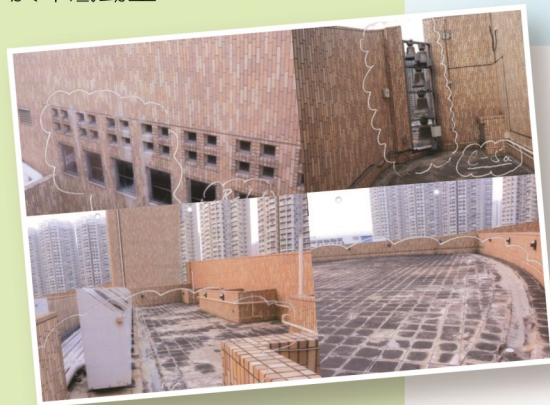
• 聖堂建築物天台多處地方出現嚴重滲漏，急需維修，預期今年雨季結束後，會於年底開始動工，同時需更換上了十六年的空調系統。