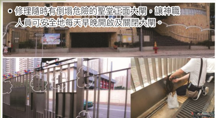
• 修理時有倒塌危險的聖堂正面大閘，讓神職人員可安全地每天早晚開放及關閉大閘。