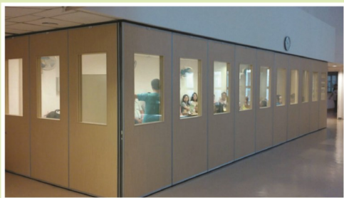
• 由於會議場地不敷應用，已在四樓禮堂增設「活動屏風房」。

這個"家"需要我們的支持和愛護！大家付出的一分一毫都非常重要，請齊來共建我們美好的"家"！