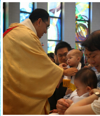
4月5日 新教友及嬰兒領洗