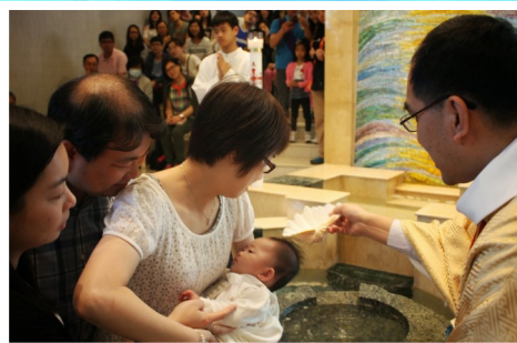
4月12日 新教友迎新日